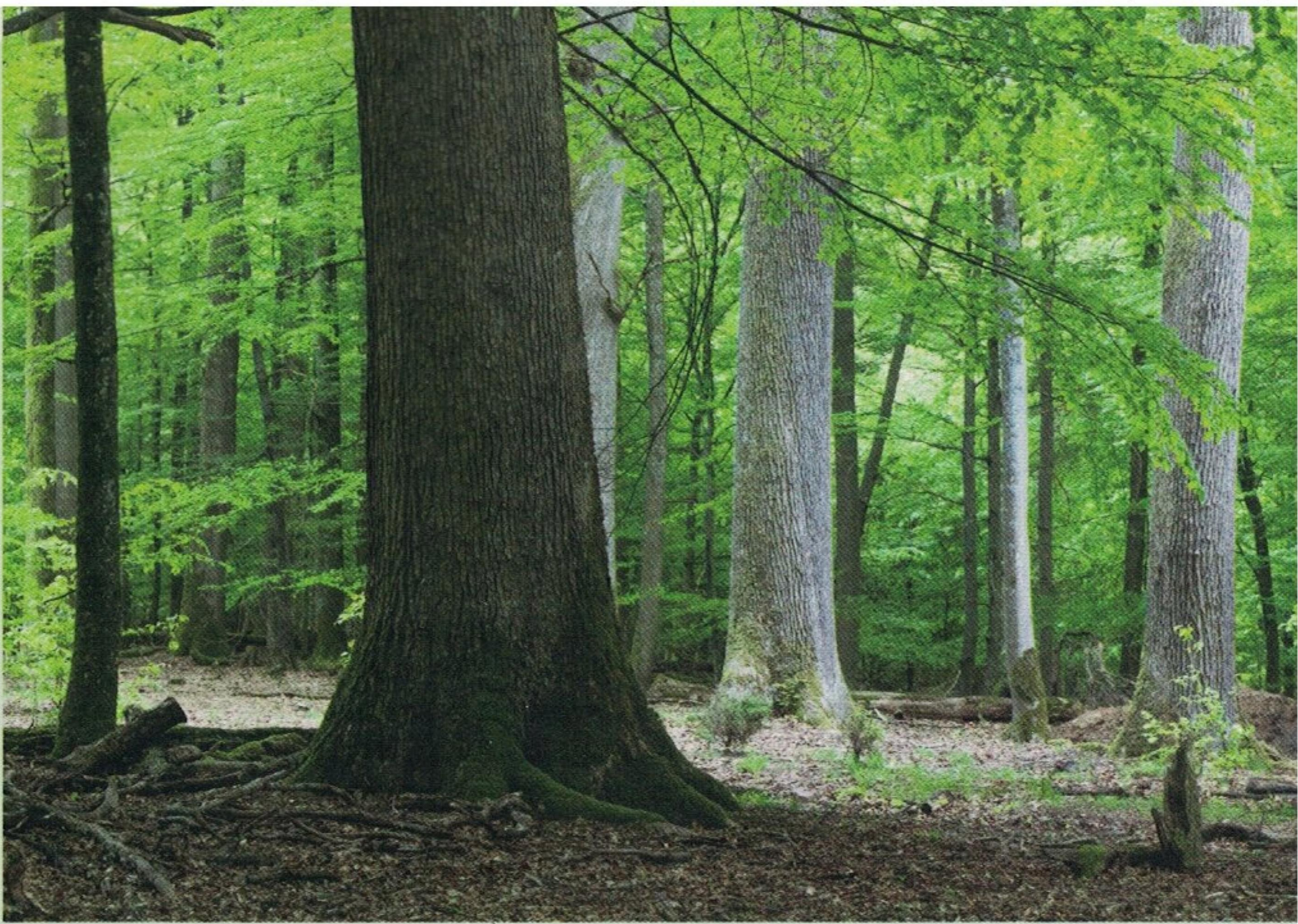
Bild oben | Im Spessart stehen uralte Eichenveteranen mit Buchen im Unterstand.

Ähnliche Wälder findet man zum Beispiel auch an den steilen Hängen von Rhein und Neckar. Berühmt aber durch Selektion und Pflanzung entstanden sind Eichenwälder des Spessarts. Hier wachsen Eichen dicht an dicht über Jahrhunderte nebeneinander und produzieren so astfreie Stämme, die der Traum eines jeden Försters sind. Besonders schöne Eichenwälder gibt es zum Beispiel im Naturre-